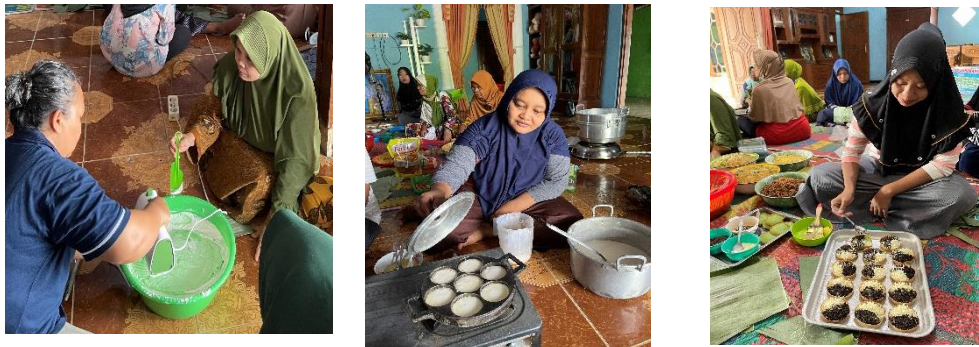
Gambar 3. Jajanan Pasar “Martabak Mini”

Kegiatan PKM ini menghasilkan banyak jenis makanan tradisional, hal ini bertujuan agar banyaknya inovasi makanan yang dapat diolah oleh Ibu-Ibu PKK sehingga dapat digunakan sebagai referensi dalam membuat aneka makanan dan dapat dijual dipasar-pasar sehingga akan menambah pendapatan bagi Ibu-Ibu PKK Kelurahan Gebang. Berbagai jenis makanan yang sudah jadi dan sudah dihias dapat disajikan sebagai berikut: