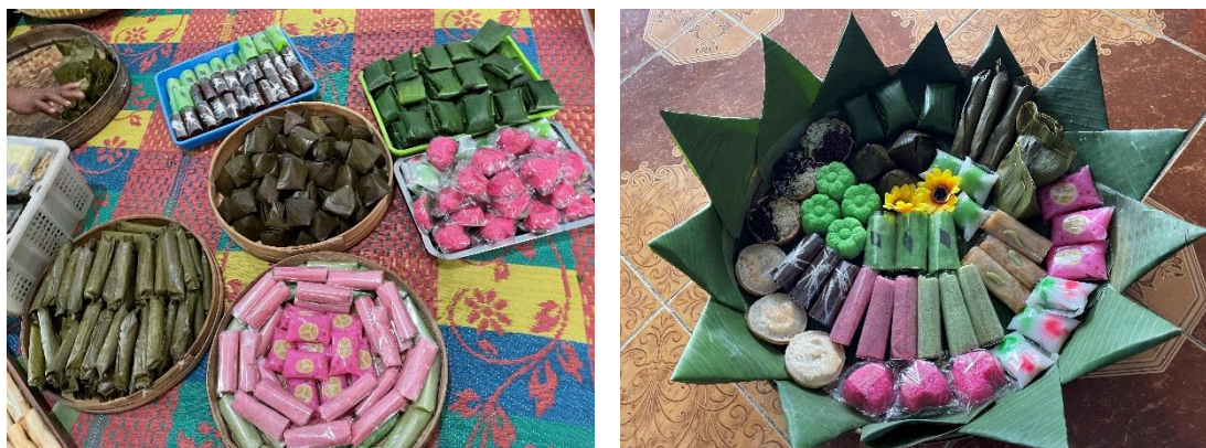
Gambar 4. Aneka Ragam Jajanan Pasar

Kegiatan PKM ini menghasilkan banyak jenis makanan tradisional, hal ini bertujuan agar banyaknya inovasi makanan yang dapat diolah oleh Ibu-Ibu PKK sehingga dapat digunakan sebagai referensi dalam membuat aneka makanan dan dapat dijual dipasar-pasar sehingga akan menambah pendapatan bagi Ibu-Ibu PKK Kelurahan Gebang. Berbagai jenis makanan yang sudah jadi dan sudah dihias dapat disajikan sebagai berikut: