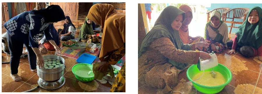
Gambar 1. Jajanan Pasar “Putu Ayu”