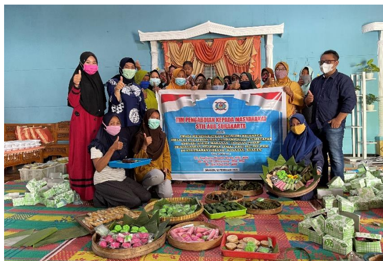
Gambar 5. Tim Pengabdian Kepada Masyarakat