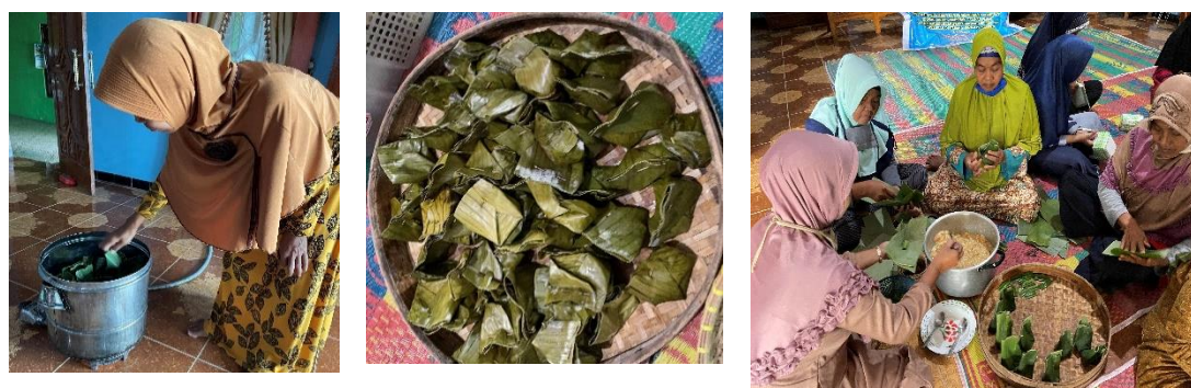
Gambar 3. Jajanan Pasar “Karanggesing”

Makanan tradisional karanggesing merupakan sebutan makanan untuk Bahasa Jawa, yang merupakan makanan yang terbuat dari pisang yang sudah dipotong-potong kecil, santan kental, gula pasir, sedikit garam, telur dikocok lepas, daun pandan, serta daun pisang yang digunakan untuk membungkus makanan. Setelah semua bahan dicampur jadi satu wadah kemudian diaduk dan di bungkus menggunakan daun pisang dan ditusuk dengan lidi agar makanan bisa membentuk dengan baik. Setelah itu dapat dikukus hingga matang ketika daun sudah berwarna kecoklatan