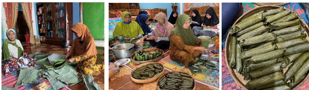
Gambar 2. Jajanan Pasar “Utri”

Utri adalah jenis makanan tradisional yang terbuat dari bahan baku singkong, yang kemudian dihaluskan dengan menggunakan alat “parut” dalam Bahasa Jawa dan dicampur dengan gula sedikit garam, kelapa muda, gula Jawa yang kemudian dicampur jadi satu dan dimasukkan ke dalam daun pisang kemudian dibentuk sesuai selera.