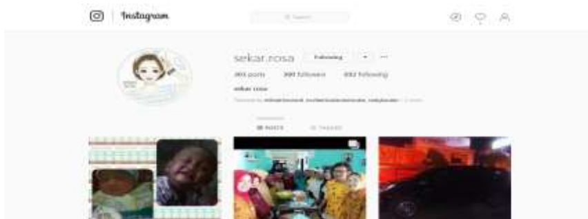
Gb.5 Instagram Peserta Kegiatan