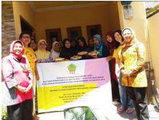
Gb 1. Foto Bersama Peserta