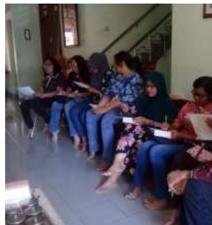
Gb 4. Post Test