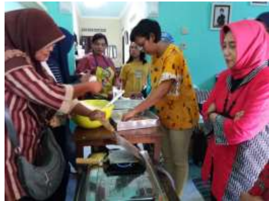
Gb 2. Foto Memasak Kue